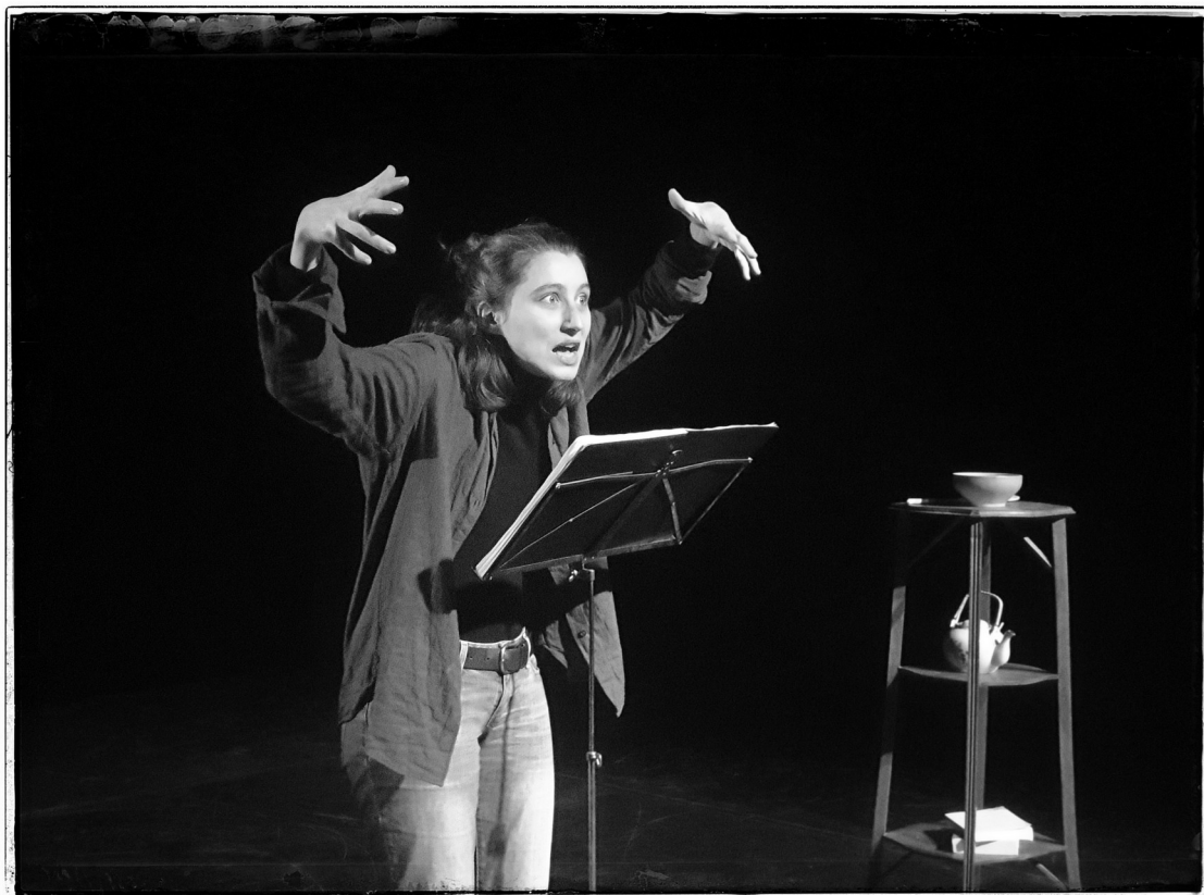
Dans la forêt - La Sauvage - Lorine Wolff

Partenaires Théâtre Jean Lurçat - Scène Nationale d'Aubusson (23) Association Houraillis (35) l'Anis Gras - Le lieu de l'Autre (94)